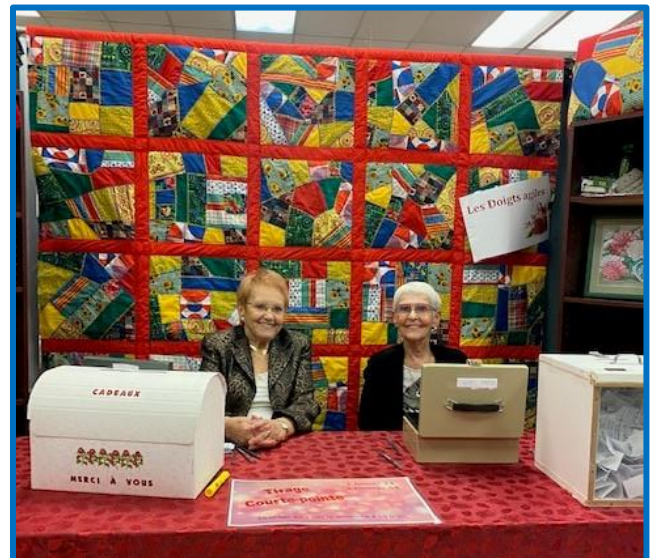
Bénévoles à la Foire des artisans