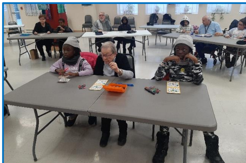
2 e éditions de l'activité de Bingo intergénérationnelle