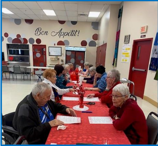
Activité au centre communautaire