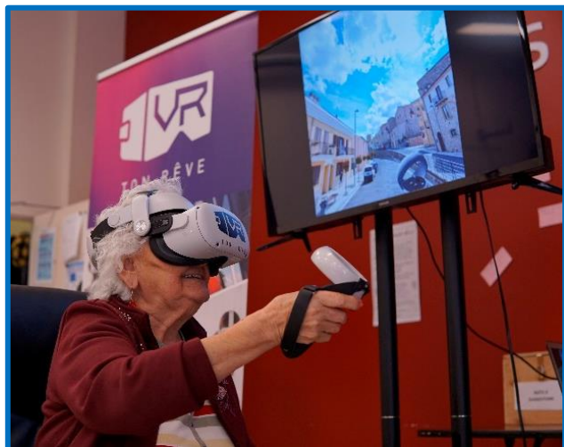
Activité de réalité virtuelle pour les membres