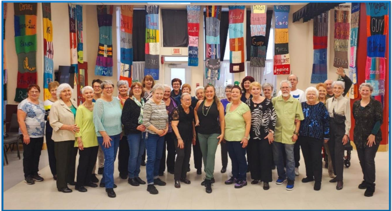
Activité de danse avec les membres et les locataires : Spécial Saint-Patrick