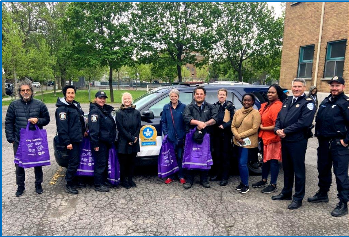
Visite aux aînés du quartier le 18 mai 2022