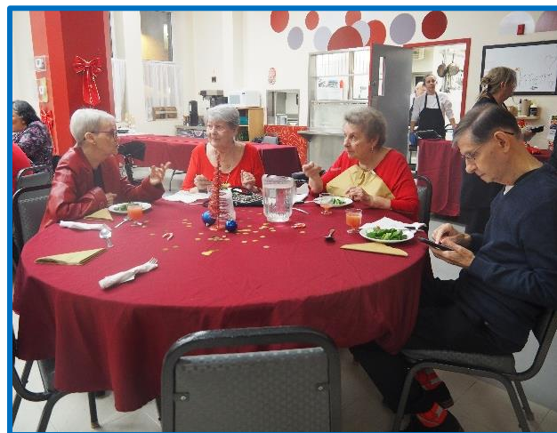
Souper de Noël du centre communautaire