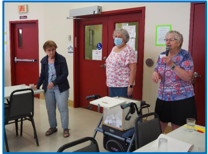
Tirage du moitié moitié